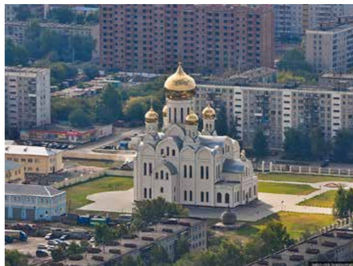
Троице-Владимирский собор, г.Новосибирск