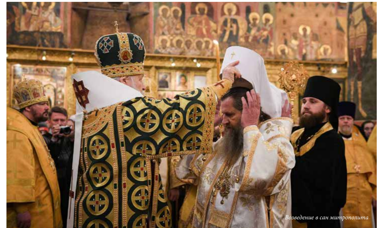
Возведение в сан митрополита

- Родители были обычными советскими людьми, честно жили и трудились. Мама на Пасху - я всегда ждал этого дня - обязательно пекла вкусные куличи, и это была теплая семейная традиция.