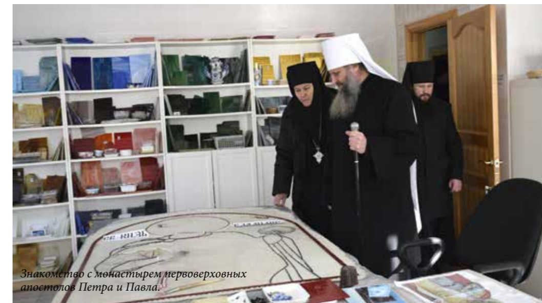
Знакомство с монастырем первоверховных апостолов Петра и Павла.