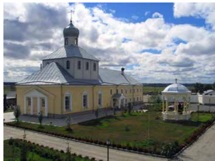
С. Козиха. Мужской монастырь в честь Архангела Михаила. Современный вид